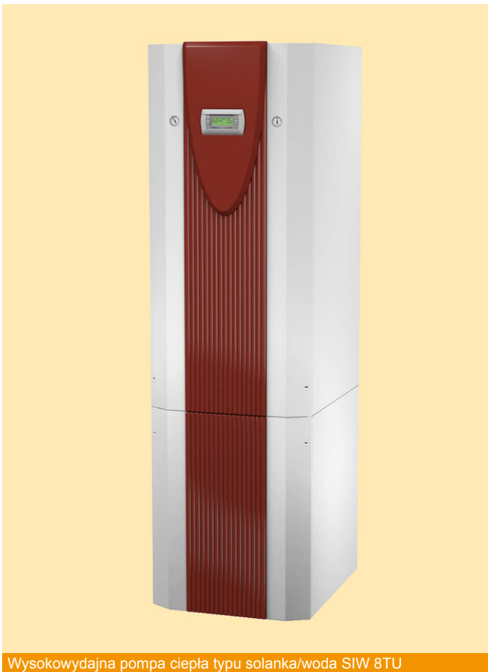
Wysokowydajna pompa ciepła typu solanka/woda SIW 8TU